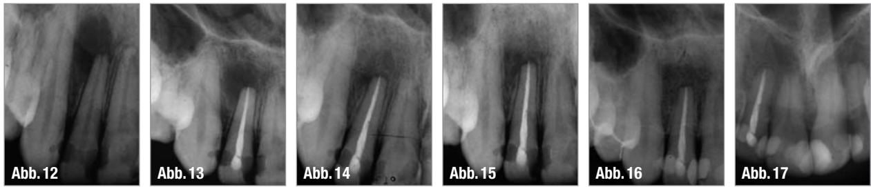
▲ Abb. 13: Kontrollaufnahme 1999 – die Wurzelkanalfüllung erfolgte mithilfe thermoplastifizierter Guttapercha in vertikaler Kondensationstechnik. ▲ Abb. 14: Kontrollaufnahme 2000 – die apikale Läsion zeigt eine deutliche Verkleinerung – die Heilungsdynamik der Läsion ist erkennbar, auch wenn apikal ein leicht verbreiteter PA-Spalt erkennbar ist. ▲ Abb. 15: Kontrollaufnahme 2003 – die apikale Läsion ist komplett verschwunden, der PA-Spalt erscheint apikal noch leicht erweitert. ▲ Abb. 16: Kontrolle 2006 – klinisch unauffälliger Zahn 12, röntgenologisch leicht verbreiteter apikaler PA-Spalt. ▲ Abb. 17: Kontrollaufnahme 2010 – 11 Jahre post OP – stabile apikale Verhältnisse apikal normal erscheinende Strukturen, PA-Spalt unauffällig, apikale Läsion komplett ausgeheilt.