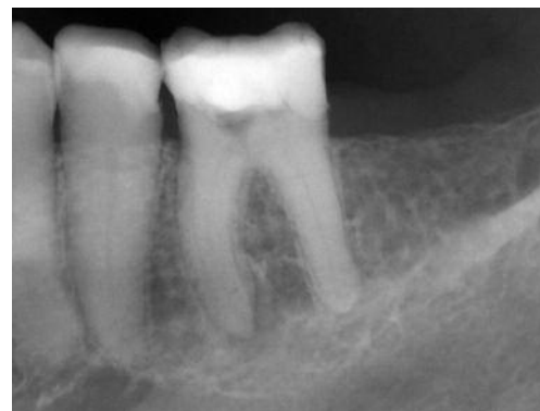
Abb. 4: Zahn 36 Übersichtsaufnahme, orthoradial.

Die akute Symptomatik machte eine Leitungsanästhesie des N. mandibularis zur Ausschaltung der Schmerzen während der Behandlung notwendig. Nach Anlegen des Kofferdams und Trepanation konnte das gesamte Pulpakammerdach entfernt und die Kanaleingänge dargestellt werden. Die Entfernung der Zahnhartsubstanz kann entweder mit einem diamantbelegten FG-Bohrer oder noch sicherer mit diamantbelegten Ultraschallansätzen erfolgen. Im vorliegenden Fall wurde aufgrund der massiven Kalzifikation der Pulpakammerboden im Bereich der Kanaleingangöffnungen vorsichtig mit einem ultraschallaktivierten diamantbelegten Kugelansatz bearbeitet, um die Kanaleingangsbereiche optimal darzustellen (Abb. 5).