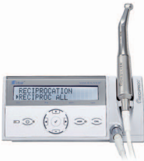
Abb. 3a: VDW.SILVER® RECIPROC® Motor.