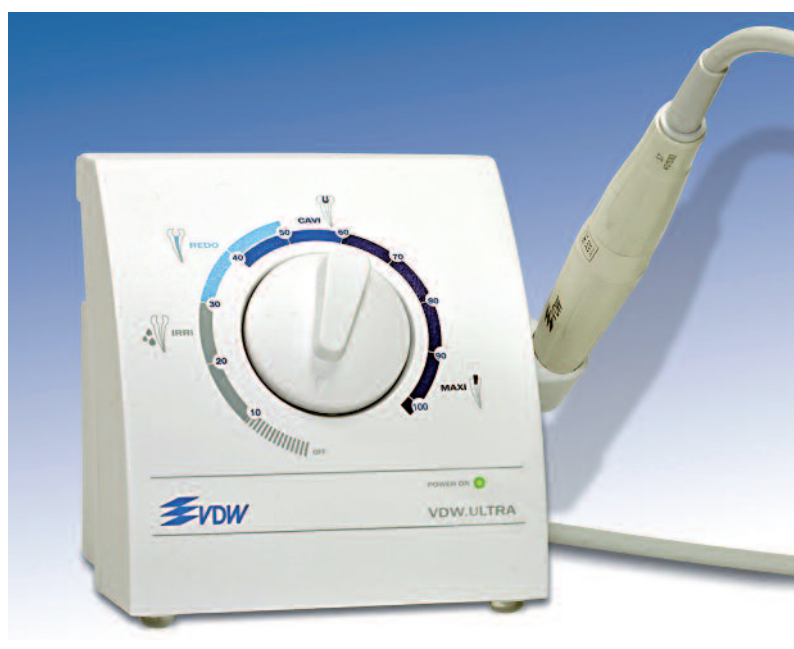
Abb. 5: Ultraschallgerät VDW.ULTRA®.

Bei Betrachtung des Pulpakammerbodens mithilfe eines Dentalmikroskops (PROergo, Zeiss, Oberkochen) fallen sowohl im mesialen als auch im distalen Pulpakammerbereich Vertiefungen auf, welche nach Sondierung als Kanaleingangöffnungen dargestellt werden können. Die initiale koronale Sondierung erfolgte mit MC-Feilen, welche eine Instrumentengeometrie ähnlich der klassischen Handinstrumente aufweisen (K-Feilen oder Hedströmfeilen), allerdings einen sondenähnlichen Griff besitzen und somit die Sicht unter dem Mikroskop nicht beeinträchtigen. Nach Lokalisation der Kanaleingänge wurde die Kanalgängigkeit mit C-Pilot®-Feilen in den ISO Größen 006–008 und 010 kontrolliert. Die Länge der einzelnen Kanäle wurde zunächst aufgrund