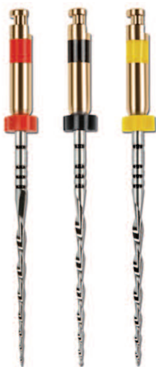
Abb. 1: RECIPROC®-Instrumentenset.

Die irreversible Schädigung des pulpalen Gewebes und die Infektion der periapikalen Strukturen durch bakterielle Kontamination des endodontischen Systems stellen die Hauptindikation zur endodontischen Behandlung des betroffenen Zahns als letzter Versuch der Zahnerhaltung dar. 1 Die primäre endodontische Behandlung eines Zahns mit oder ohne Beteiligung periapikaler Strukturen ist eine anerkannte Behand-