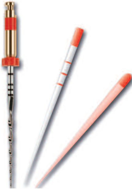
Abb. 2a: RECIPROC®-Set: Instrument, Papier- und Guttaperchaspitze, hier Spitzendurchmesser 025.

Stifte sowie die geeignete Antriebseinheit (VDW.SILVER® RECIPROC® Motor, VDW.GOLD® RECIPROC® Motor).