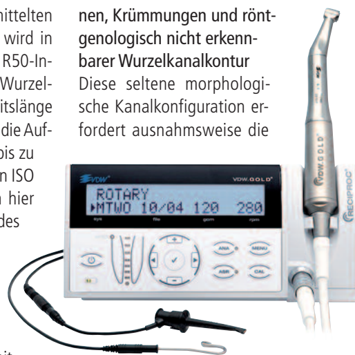
Abb. 3b: VDW.GOLD® RECIPROC® Motor – mehr Bedienungsoptionen und integrierte elektrometrische Längenbestimmungsmöglichkeit.

Diese seltene morphologische Kanalkonfiguration erfordert ausnahmsweise die