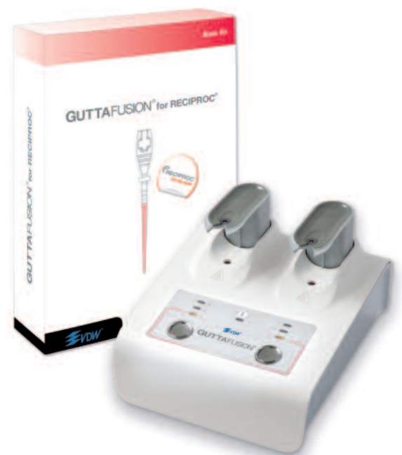
Abb. 2b: Trägerbasiertes Obturationssystem abgestimmt für RECIPROC®-Instrumente.

Das präoperative Röntgenbild, eventuell eine dreidimensionale digitale volumetomografische Aufnahme (DVT), liefern die notwendigen Informationen bezüglich des anatomisch bedingten Schwierigkeitsgrades und ermöglichen die Einteilung der zu behandelnden Fälle in folgende Kategorien. Diese Einteilung soll bei der Wahl des geeigneten Aufbereitungsinstrumentes helfen: