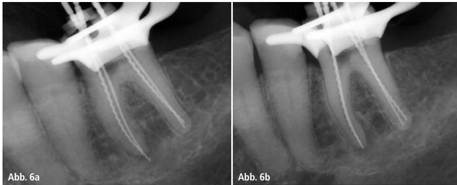
Abb. 6a: Orthoradiale Messaufnahme – leichte Überinstrumentierung mesial. – Abb. 6b: Exzentrische Messaufnahme – Korrektur der mesialen Arbeitslänge.

der Übersichtsaufnahme geschätzt, die initiale Arbeitslängenbestimmung erfolgte mithilfe einer elektrometrischen Messung mit dem RAYPEX®6-Elektrometriegerät. Die Werte wurden für jeden einzelnen Kanal notiert. Die Messungen wurden nach jedem Instrumentenwechsel wiederholt, die Werte zeigten eine hohe Reproduzierbarkeit und wurden somit als definitiv einzuhaltende Ar-